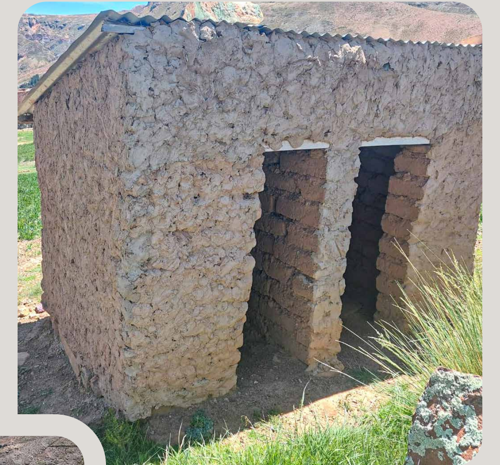
Aktueller Zustand der Sanitäranlagen