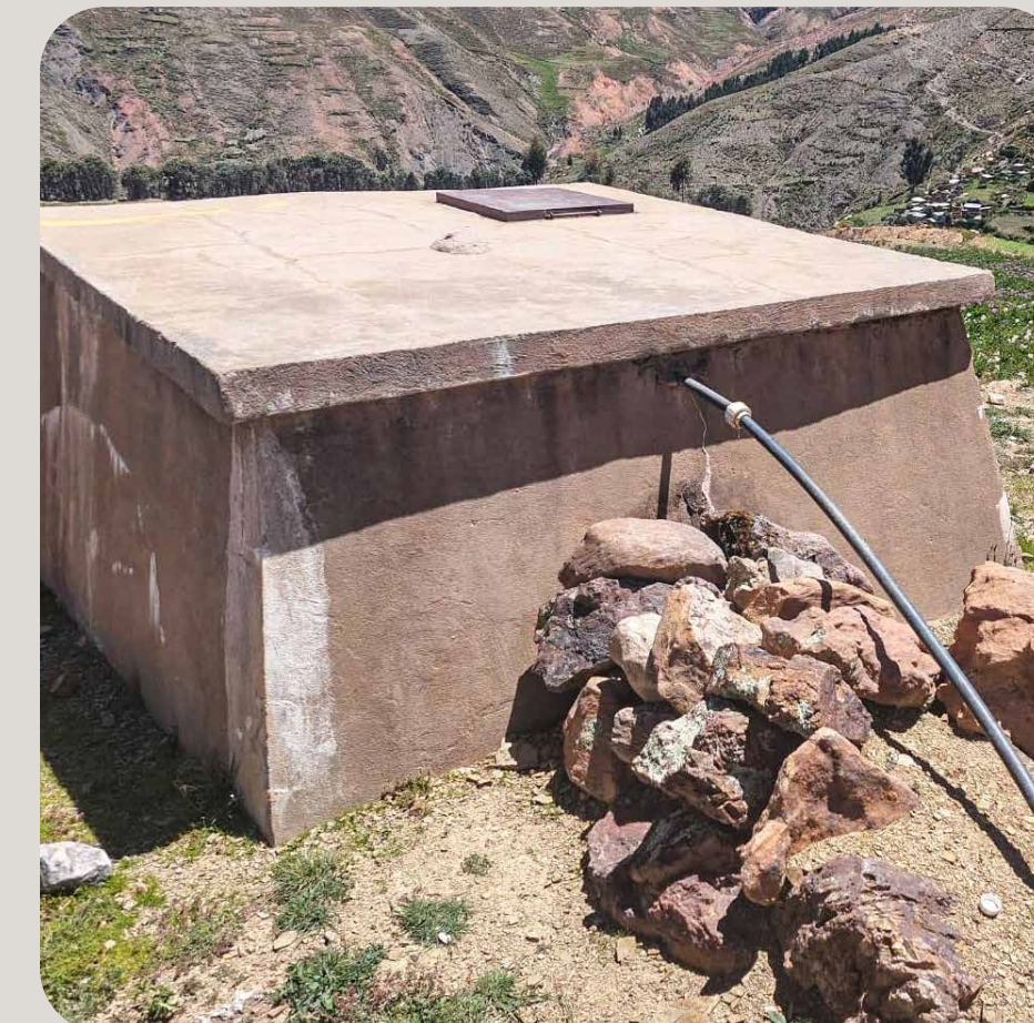
Aktueller Wassertank und Leitungen