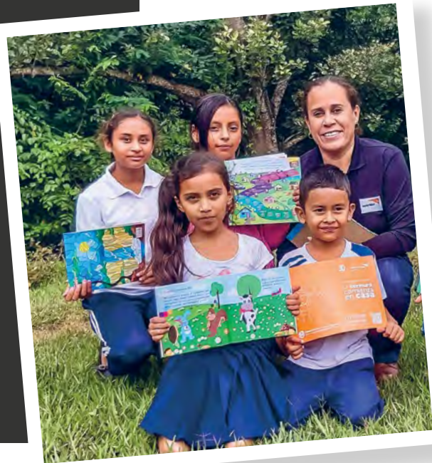
Dieses Foto wurde vor der Covid-19-Pandemie aufgenommen oder entspricht den lokal geltenden Vorschriften.