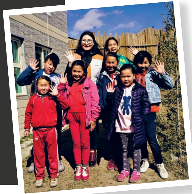
Dieses Foto wurde vor der Covid-19-Pandemie aufgenommen oder entsprach den lokal geltenden Vorschriften.