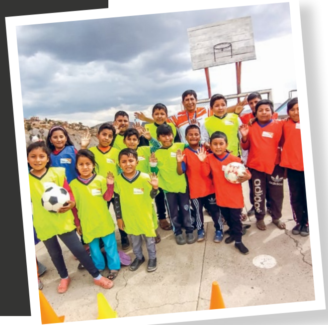
Dieses Foto wurde vor der Covid-19-Pandemie aufgenommen oder entsprach den lokal geltenden Vorschriften.